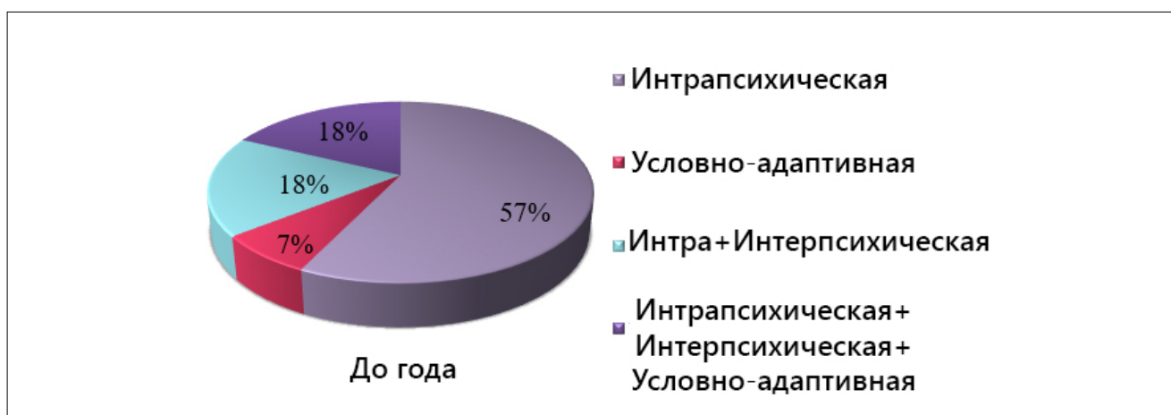
Рисунок 2. Диаграмма распределения частоты встречаемости разных видов направленности личностного реагирования на болезнь при длительности СР до года

Для женщин с продолжительностью течения СР до года характерна высокая частота встречаемости интрапсихической направленности личностного реагирования на СР, что может быть связано с «уходом в болезнь», негативно отражающимся на эмоциональной сфере больных (преобладание тревожности, подавленности, реакций по типу раздражительной слабости). Полученные результаты представлены на рисунках 2 и 3.