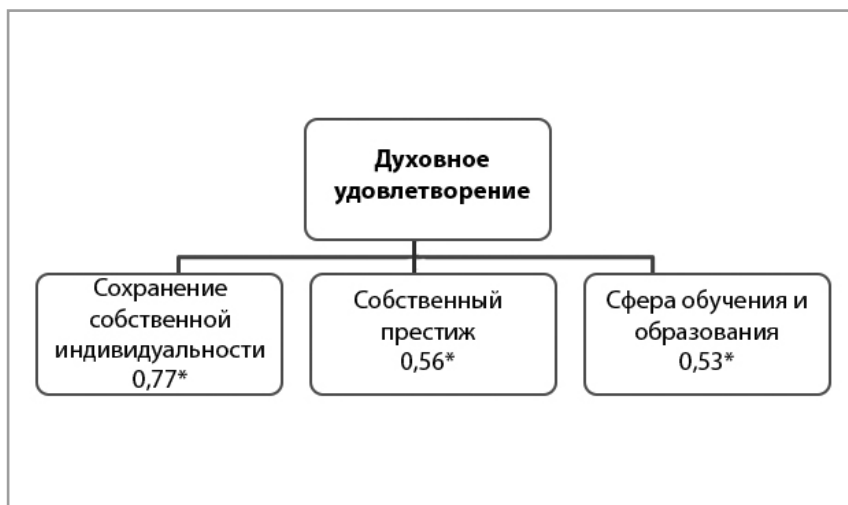
Рисунок 2. Значимые связи ценности «духовное удовлетворение» для группы с высоким уровнем субъективного благополучия

Ниже представлена корреляционная плеяда, отражающая достоверные корреляционные связи ценности «духовное удовлетворение» (рисунок 2) в группе с высоким уровнем субъективного благополучия.