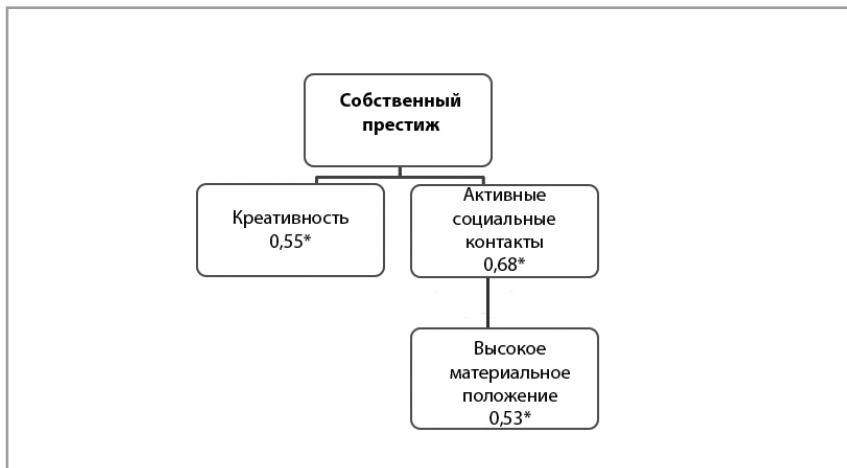
Рисунок 4. Значимые связи ценности «собственный престиж» для группы с низким уровнем субъективного благополучия

ценность «активные социальные контакты» имеет корреляционную связь с ценностью «высокое материальное положение» (0,532) (рисунок 4).