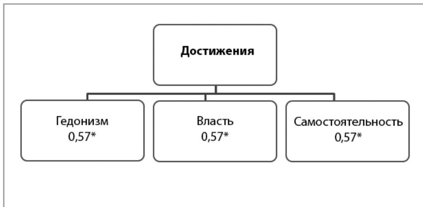
Рисунок 5. Значимые связи ценности «достижения» для группы с низким уровнем субъективного благополучия