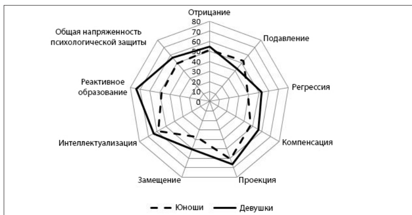
Рисунок 1. Профиль психологической защиты юношей и девушек