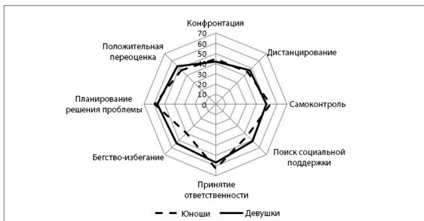
Рисунок 2. Профиль совладающего поведения юношей и девушек