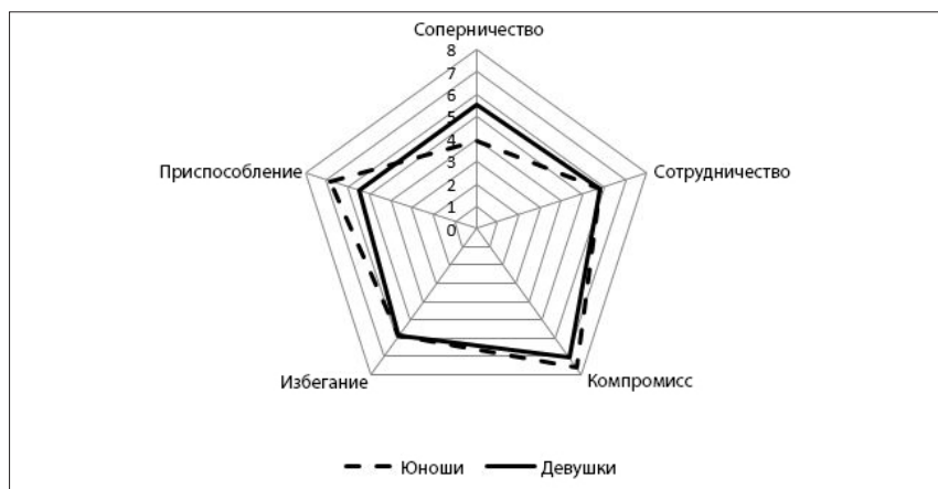
Рисунок 3. Профиль поведения в конфликте юношей и девушек