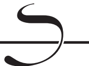
Рисунок № 2 «СЛУШАТЕЛИ»