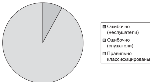
Рисунок № 3 «МУЗЫКАНТЫ»

Из рисунка видно, что, основываясь на полученных данных, мы с 84 % вероятностью правильно дифференцировали «слушателей» от «музыкантов» и неслушателей». Основываясь на данных, полученных при помощи корреляционного анализа Спирмена и Дискриминантного анализа, мы можем говорить о следующих особенностях данной группы: люди, находящиеся в постоянном контакте с искусством, более приобщённые к музыкальной культуре оказываются более удовлетворёнными пройденным отрезком жизненного пути, его продуктивностью и осмысленностью, нежели музыканты. В большей степени слушатели нацелены на эстетическую составляющую своей жизни: искусство, творчество, красоту природы.