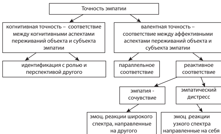
Рисунок 1. Виды точности эмпатии

В исследованиях, ставящих своей целью определить влияние фактора сходства между объектом и субъектом эмпатии на уровень точности эмпатии, используется экспериментальная инструкция, в результате которой испытуемые воспринимают какой-либо аспект их социального опыта как сходный (или различный) с социальным опытом другого. Результаты работ [12] свидетельствуют о том, что сходство социального опыта (например, участие в одном и том же психологическом эксперименте, или одинаковые результаты в психологических тестах) положительно влияет на появление у наблюдателя идентичных с партнером эмоциональных реакций в ответ на переживания последнего, которые согласно классификации Davis [12] и Eisenberg [15], можно отнести к типу параллельного эмпатического ответа.